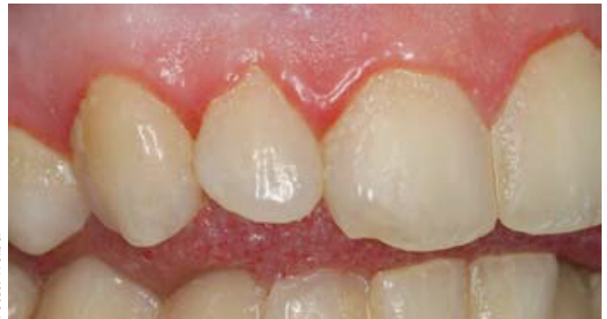
Entzündlich gerötete Gingiva in Zusammenhang mit Konkrementen (und darunter befindlichen erhöhten Sondierungstiefen, links) und in Zusammenhang mit Plaque (rechts)